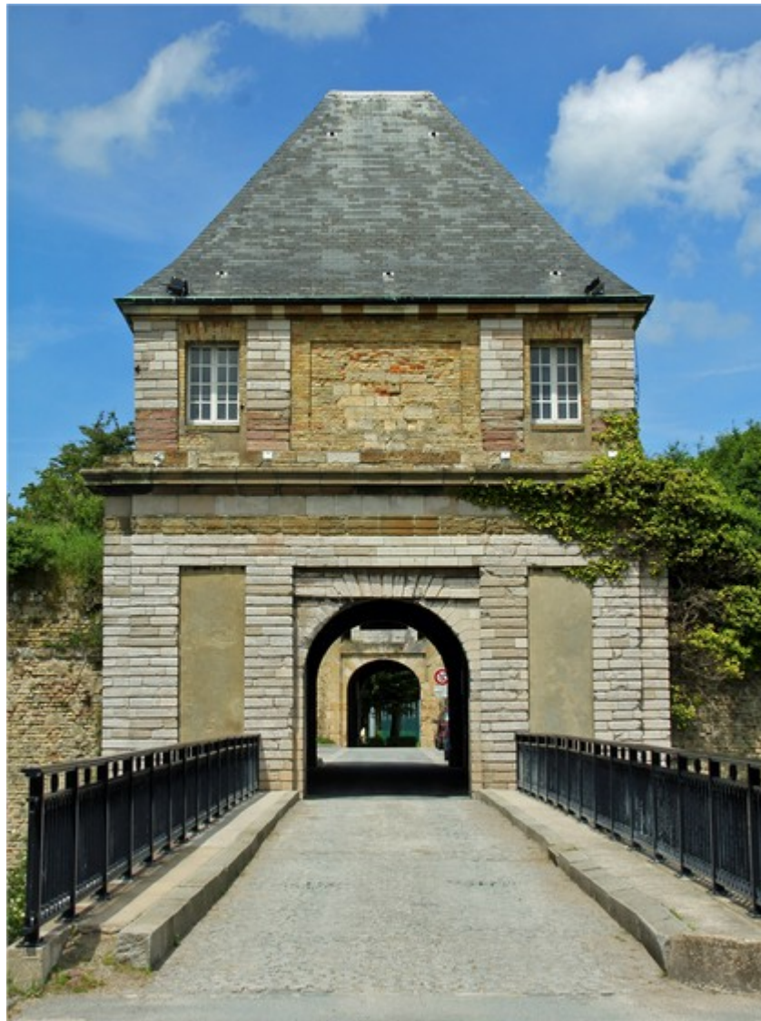
Après la deuxième porte, tout au fond à droite