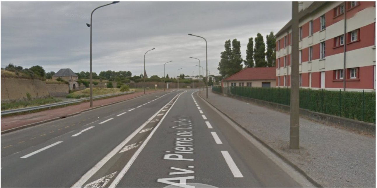
Entrée de la citadelle par l'avenue Pierre de Coubertin